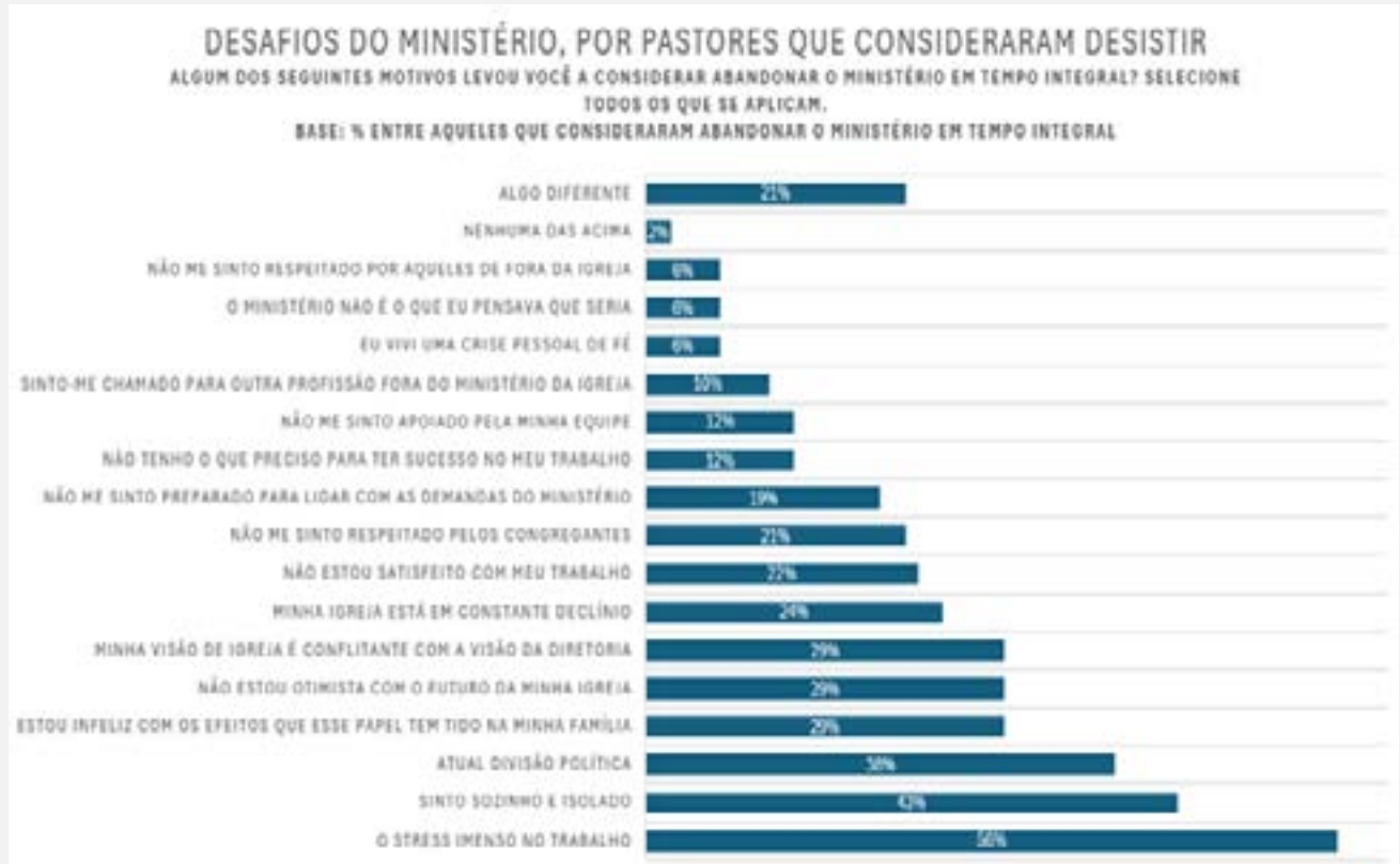
Figura 1: Pesquisa com pastores que consideraram desistir do ministério