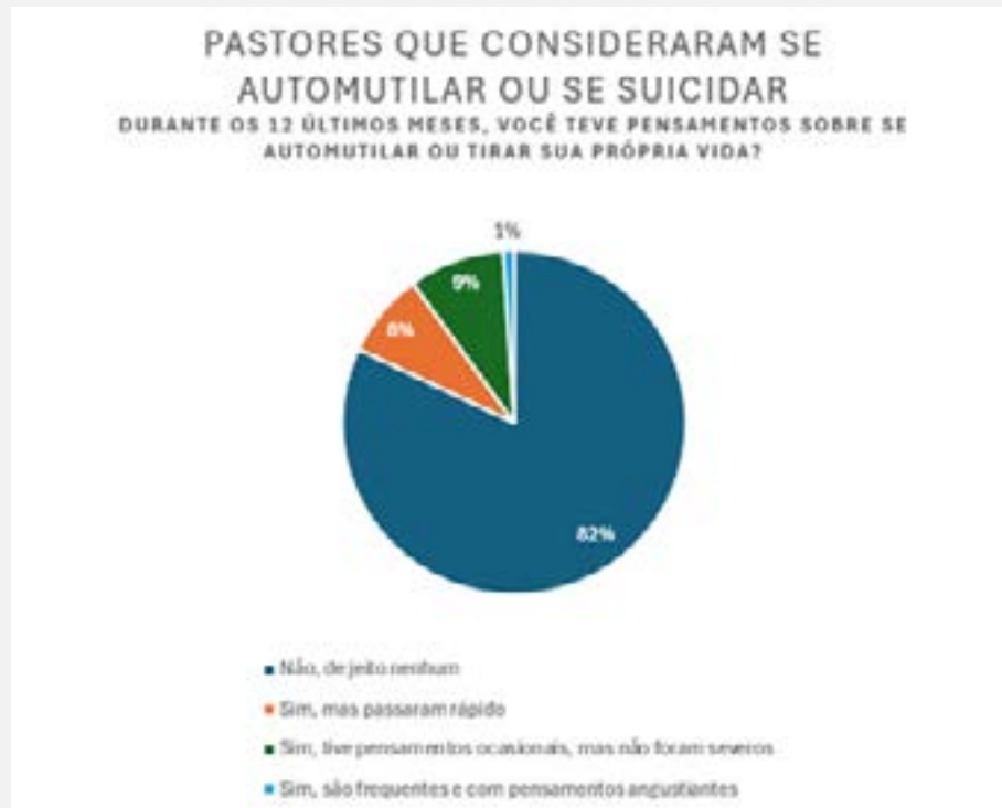
Figura 3: Pastores que consideraram se automutilar ou se suicidar

disso, é crucial que os seminários e instituições de formação teológica incluam disciplinas que preparem os futuros pastores para lidar com os desafios emocionais e psicológicos do ministério.