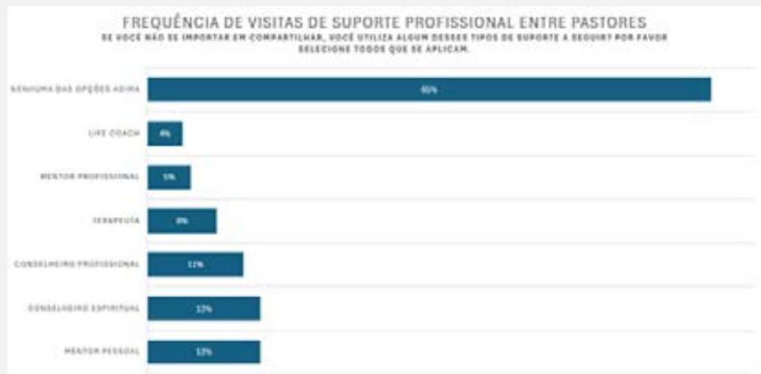
Figura 2: Frequência de visitas de suporte profissional entre pastores